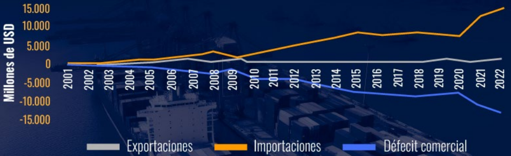
Gráfico 1. Centroamérica: exportaciones, importaciones y déficit comercial con la RPC

Nota: no incluye datos de maquilas